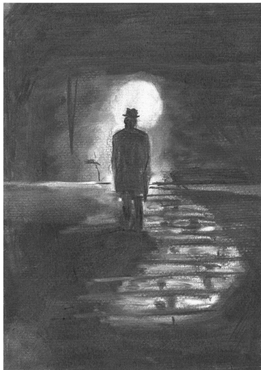
Alexandre V., classe EV 11S – 20 - 21